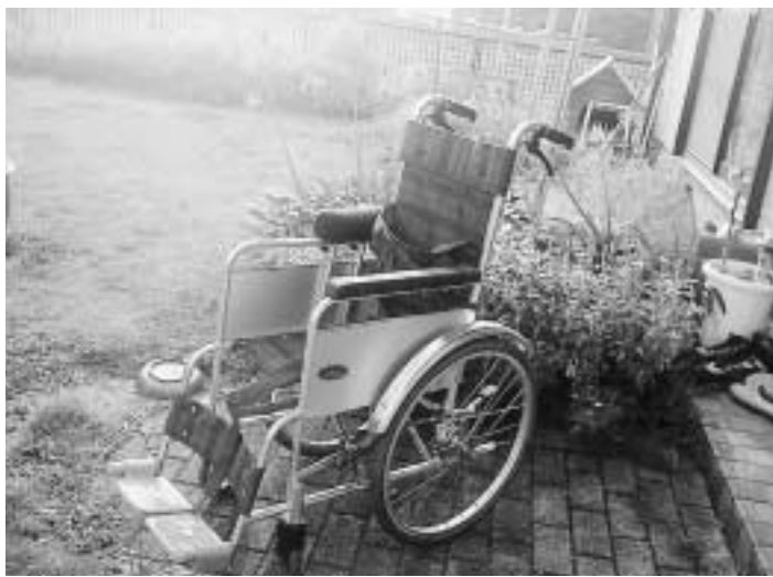
車イスも「障がい者補装具補助金」廃止の対象に

小中学校生の保護者に対する補助金制度についての請願(和光中学校親和会)が、多数の賛成で採択されました。ところが、市長は、採択請願への対応について、「願意に沿うことはできない」ととても冷たい回答です。切実な市民の願いに誠実に応えるべきです。