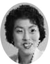
田村智子 参議院東京選挙区候補