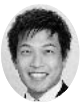
谷川智行 参議院比例代表候補