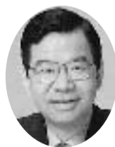
志位和夫 委員長、衆議院議員