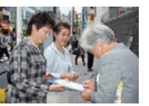
町田駅前で署名活動

みなさんと力を合わせ 国保税値上げ中止を 日本共産党は、国保税値上げ案を撤回させるために、緊急に「国民健康保険税の値上げ中止を求める署名」にとりこんでいます。 市民のみなさんが、安心して医療が受けられる国保制度の改善のためにみなさんと力を合わせて奮闘していきます。 「署名用紙」は日本共産党町田市議団のHPからダウンロードできます。