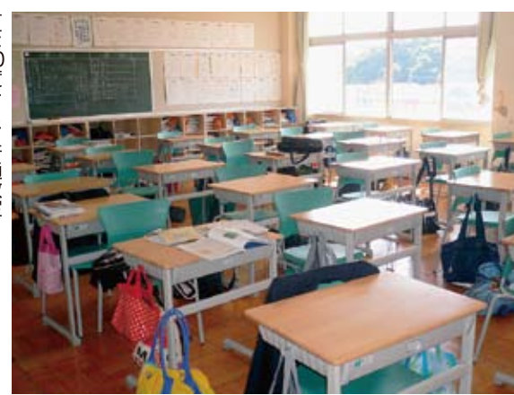
夏は30度をこす普通教室 「扇風機は外の熱をこり込むだけでほとんど涼しくならない」(08年中学生議会)

こうした中で、2005年には、音楽室など特別教室へのエアコン設置が実現。さらに、普通教室へのエアコンの早期設置を求めた日本共産党の質問(10年9月議会)に、市長が「重要課題であり、設置時期を含めて検討する」と答弁し、12月議会では、つくしの中学校の普通教室への設置工事費と中学校15校分の設計費を盛り込んだ補正予算が提案され、全会一致で可決しました。2013年度までには、小学校34校、中学校16校の876教室にエアコン設置が実現します。