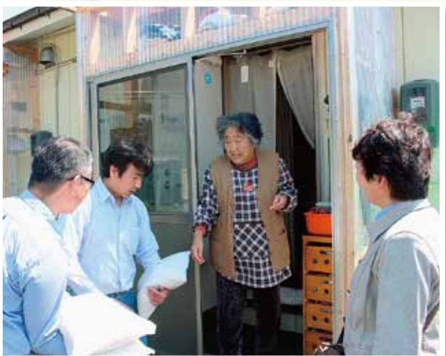
仮設住宅住民に米を届ける党市議団