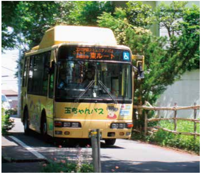
玉川学園東ルートのコミュニティバス