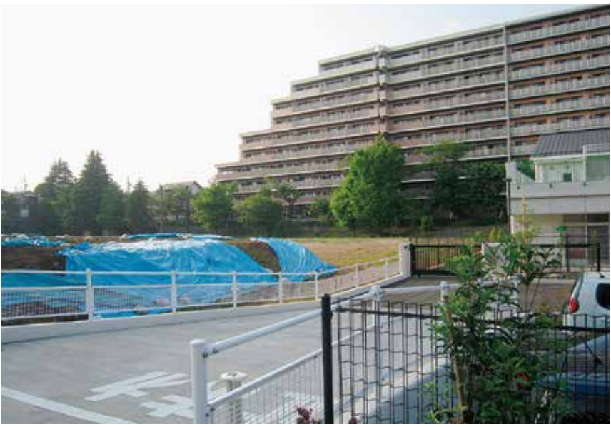
「町田の丘学園」仮設校舎建設予定地（右は市立山崎保育園）

また、玉川学園7、8丁目を走る「玉ちゃんバス」南ルートの運行事業予算（車両購入費、走行環境整備工事）や、鶴川地域から市民病院経由町田駅までの新規バス路線導入実験予算として、バス事業者へ3