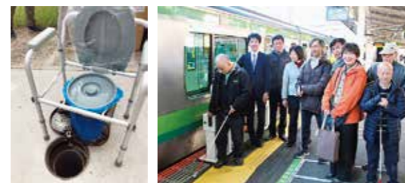
避難所のマンホールトイレ JR町田駅ホームドアを視覚障害の方々と視察(16年12月)