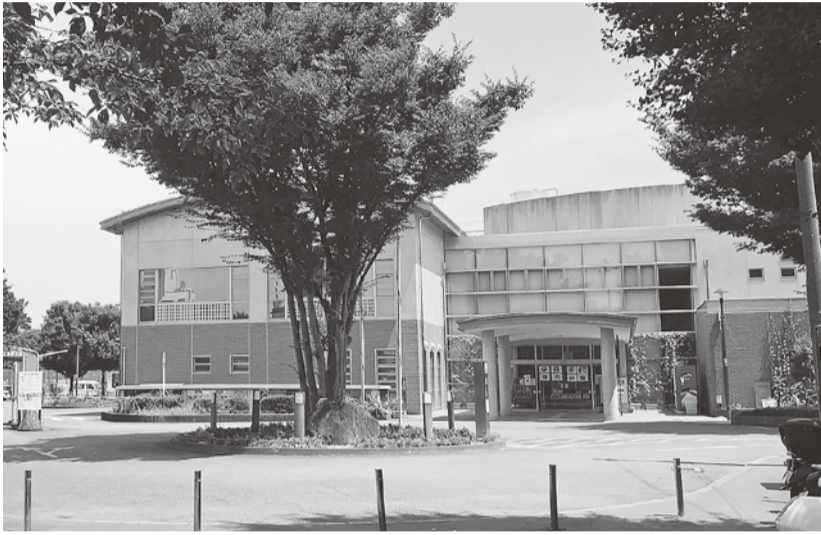
地下駐車場でPCR検査が行われているサン町田旭体育館